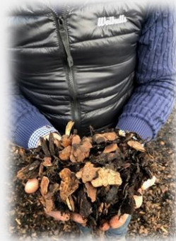
Bark och barkmull